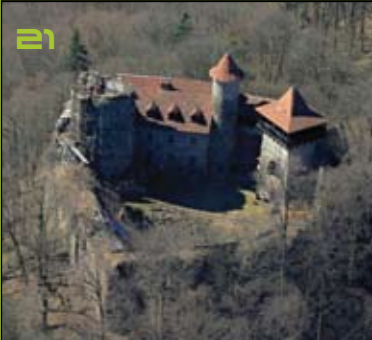
Nový Hrad u Adamova