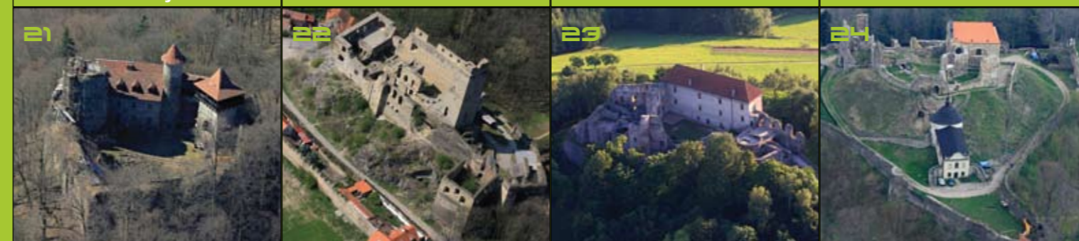
Nový Hrad u Adamova