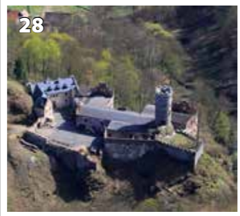
Hauenštejn Horní hrad