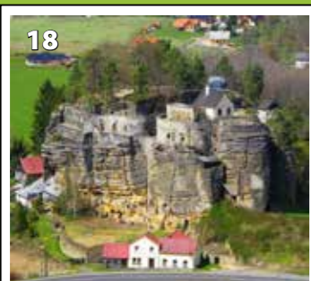
Sloup v Čechách