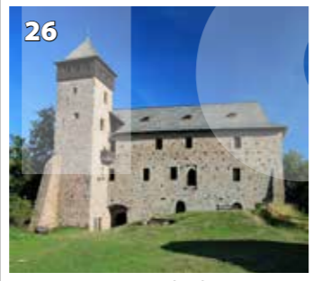
Litice nad Orlicí