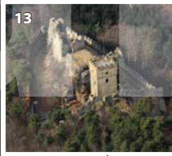
Helfenburk u Ústěku