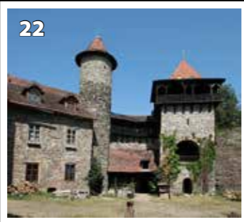
Nový Hrad u Adamova