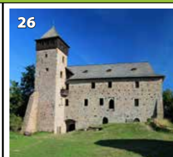
Litice nad Orlicí