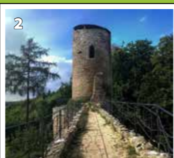
Cimburk u Koryčan