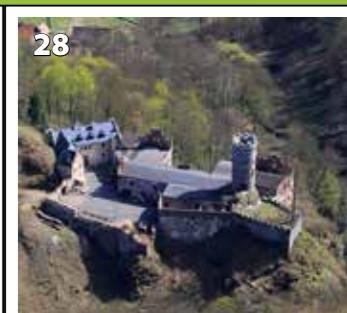
Hauenštejn Horní hrad