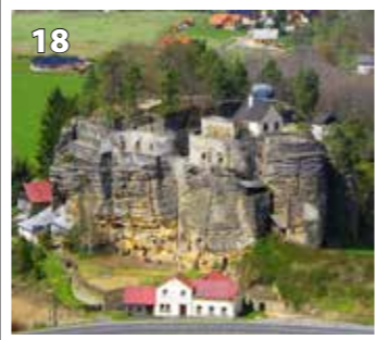
Sloup v Čechách