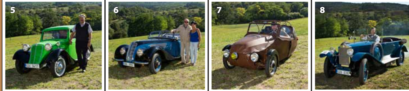
Tatra 57 A