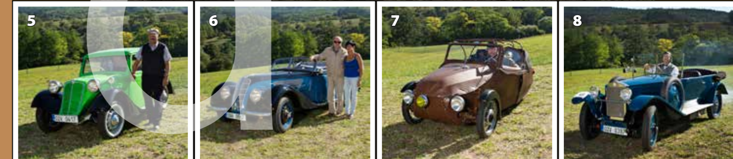
Tatra 57 A