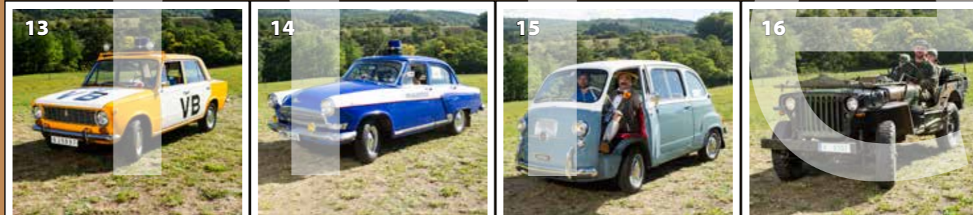
Lada 1200 VB