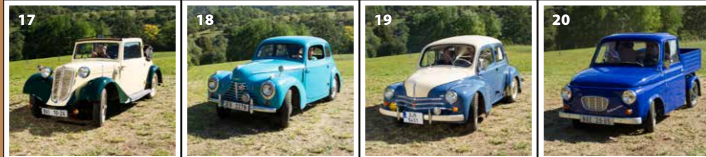
Tatra 57 A