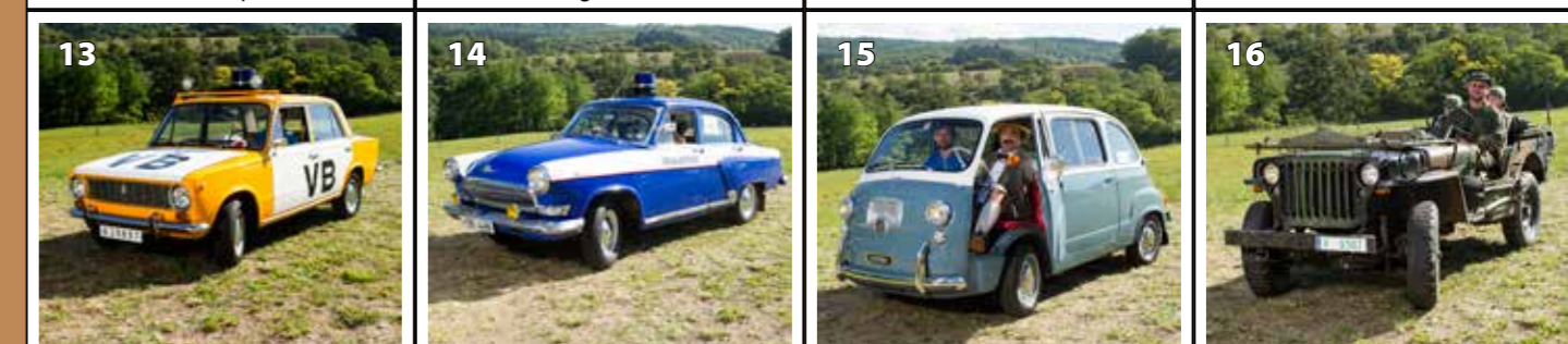
Lada 1200 VB