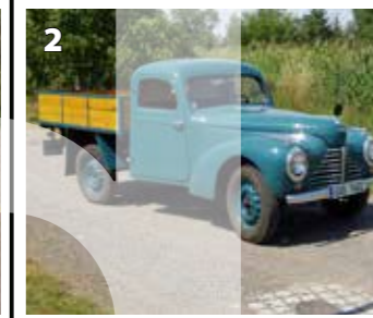
Škoda 1101 nákladní