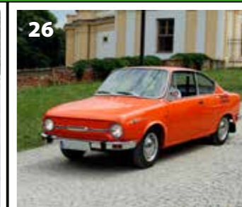
Škoda 110 R