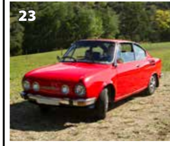
Škoda 110 R