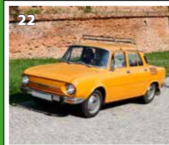
Škoda 100 L

Karty se zamíchají a rozloží lícem dolů tak, aby žádný z hráčů neznal rozložení karet. Hráči postupně otáčejí dvojici karet lícem vzhůru, aby je viděli i ostatní hráči. Pokud karty patří k sobě, hráč je odebere a otáčí další dvojici (lze hrát i variantu, ve které i po nalezení shodné dvojice pokračuje další hráč v pořadí). Pokud karty k sobě nepatří, otočí je zpět lícem dolů a pokračuje další hráč v pořadí. Hraje se tak dlouho, dokud nejsou všechny karty rozehrány. Vítězem se stane hráč s největším počtem nalezených dvojic.