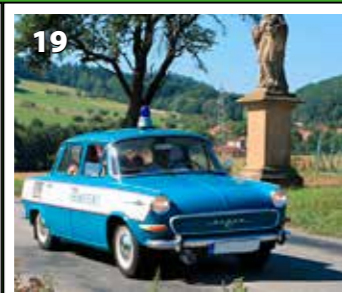
Škoda 1000 VB