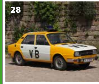
Škoda 120 L VB