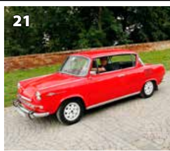
Škoda 1000 MBX