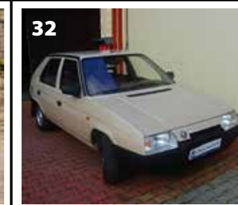
Škoda Favorit 136