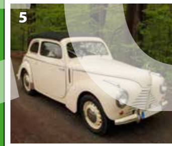
Škoda Tudor cabriolet