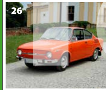
Škoda 110 R