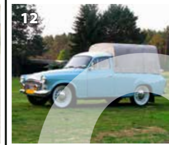
Škoda 1202 Pickup