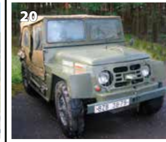
Škoda 973 Babetta