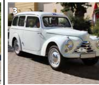
Škoda Tudor 1101 STW