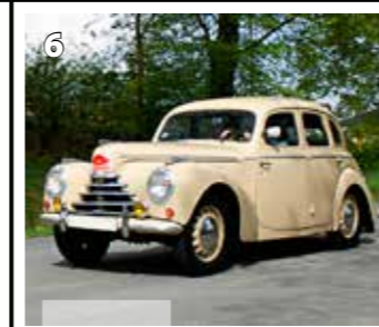
Škoda 1102 sedan