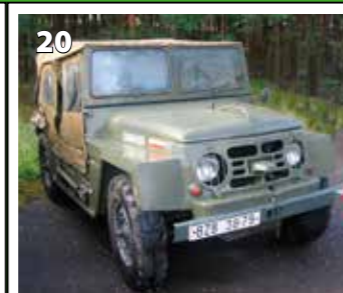
Škoda 973 Babetta