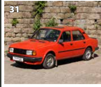
Škoda 120 GLS