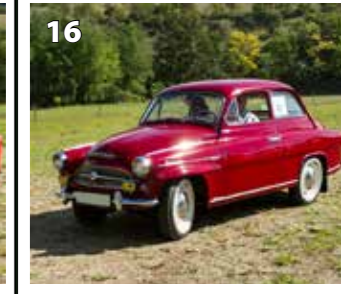
Škoda Octavia Super