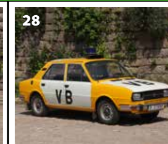
Škoda 120 L VB