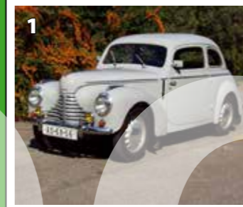
Škoda 1101 Tudor