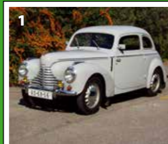
Škoda 1101 Tudor