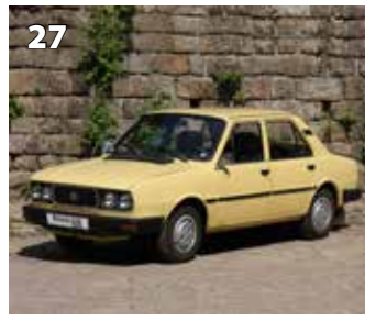
Škoda 120 GLS