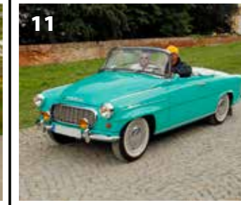
Škoda 450 roadster