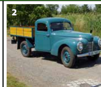
Škoda 1101 nákladní