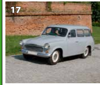
Škoda 1202 STW