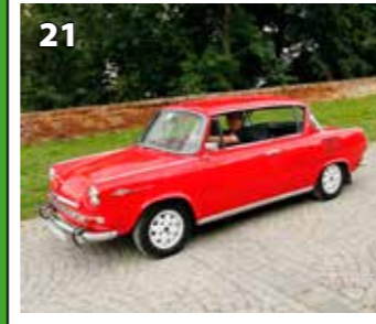
Škoda 1000 MBX