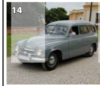
Škoda 1200 STW