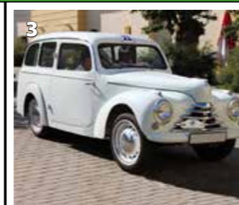
Škoda Tudor 1101 STW