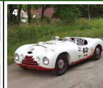
Škoda 1100 Sport