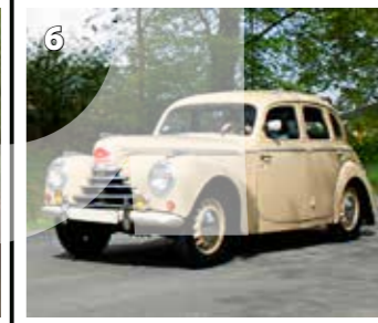
Škoda 1102 sedan