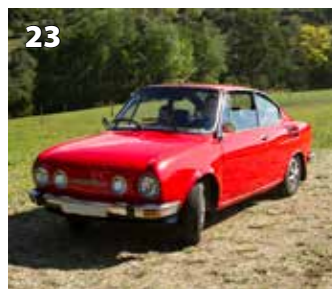
Škoda 110 R