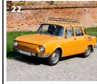
Škoda 100 L