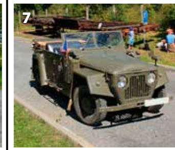
Škoda Tudor 1101 4X4