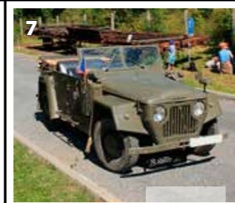
Škoda Tudor 1101 4X4