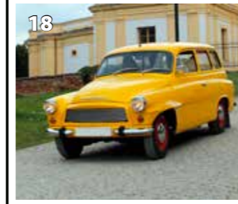
Škoda Octavia combi