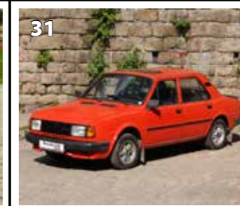
Škoda 120 GLS