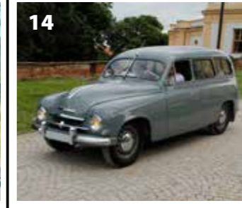
Škoda 1200 STW