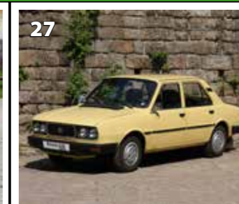
Škoda 120 GLS