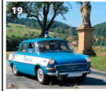
Škoda 1000 VB