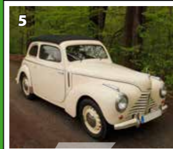
Škoda Tudor cabriolet