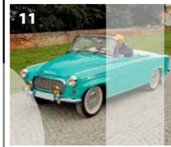
Škoda 450 roadster