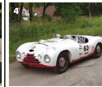
Škoda 1100 Sport