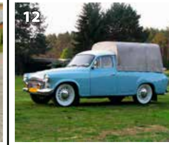
Škoda 1202 Pickup