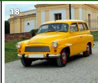
Škoda Octavia combi