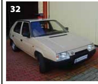
Škoda Favorit 136