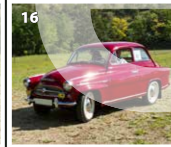
Škoda Octavia Super