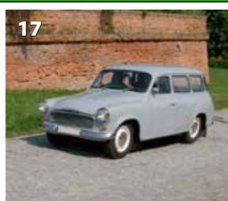
Škoda 1202 STW