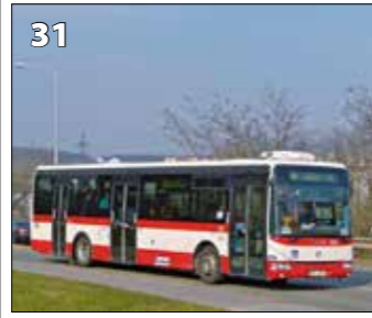
Irisbus Crossway 12 M LE – r. v. 2010