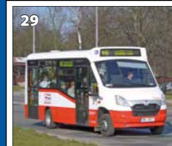
Iveco Stratos LF 38 D – r. v. 2013