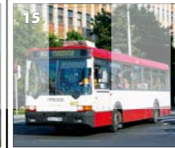
Ikarus 415 – r. v. 1998