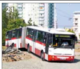
Karosa B961E.1970 – r. v. 2006