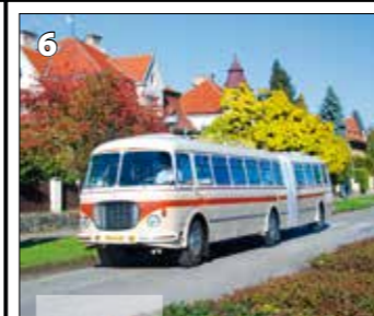
Škoda 706 RTO-K - 1960