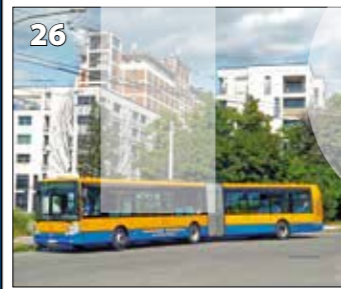
Irisbus Citelis 18 M – r. v. 2010