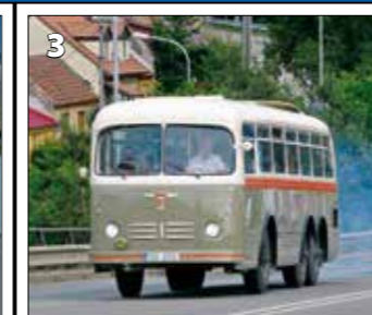
Karosa – Tatra 500HB – r. v. 1956