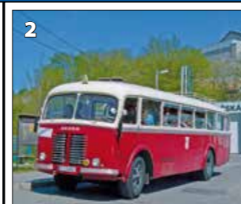
Škoda 706 RO – r. v. 1947