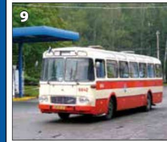
Karosa ŠM 11 – r. v. 1981