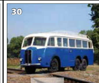
Tatra 85/91 - 1938