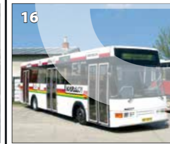
Karosa B732.1670 LEGOBUS – r. v. 1993