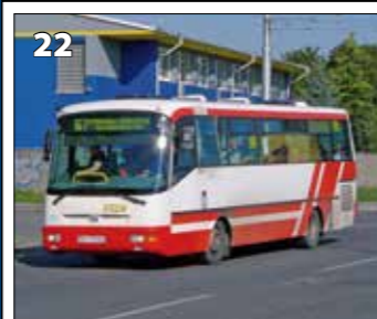
SOR B 9.5 – r. v. 2002

Karty sa zamiešajú a rozložia lícom dole tak, aby žiadny z hráčov nepoznal rozloženie kariet. Hráč postupne otáča dvojicu kariet lícom hore tak, aby obe karty videli aj ostatní hráči. Pokiaľ karty patria k sebe, hráč si dvojicu kariet vezme a otočí postupne ďalšiu dvojicu. Pokiaľ karty k sebe nepatria, otočí ich naspäť lícom dole a pokračuje ďalší hráč v poradí (je možné hrať aj verziu, v ktorej aj po nájdení zhodnej dvojice pokračuje ďalší hráč v poradí). Hra pokračuje, kým hráči nerozoberú všetky karty. Víťazom sa stane hráč s najväčším počtom nájdených dvojíc.