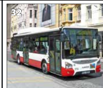
Iveco Urbanway 12 M CNG – r. v. 2015