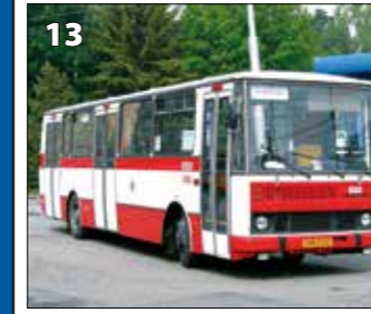
Karosa B731.04 – r. v. 1986