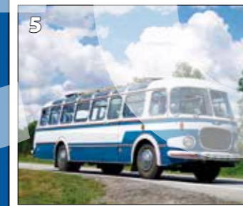
Škoda 706 RTO lux - 1962