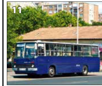
Ikarus 260.46 – r. v. 1991