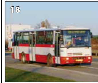
Karosa B931.1675 – r. v. 1999