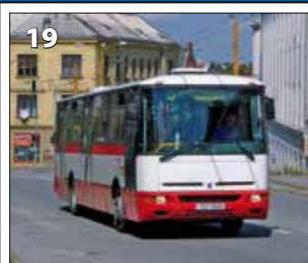
Karosa B952E.1716 – r. v. 2004