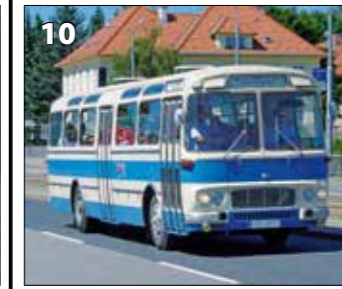
Karosa ŠL 11 – r. v. 1971