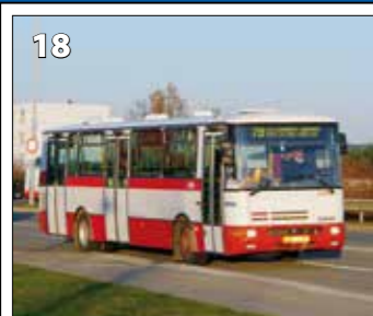
Karosa B931.1675 – r. v. 1999