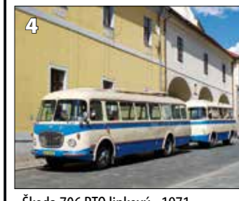
Škoda 706 RTO linkový - 1971 + Jelcz P01E - 1976