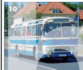
Karosa ŠL 11 – r. v. 1971