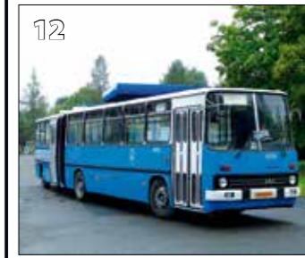
Ikarus 280.10 – r. v. 1988