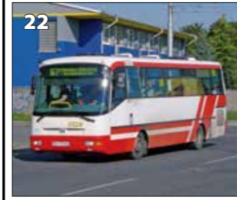
SOR B 9.5 – r. v. 2002