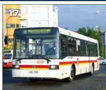
Škoda 21AB – r. v. 1995