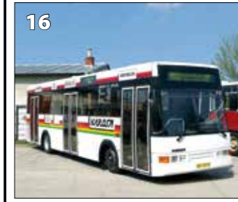
Karosa B732.1670 LEGOBUS – r. v. 1993