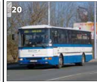
Karosa C954E.1360 – r. v. 2005