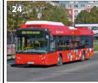
Tedom C 12 G – r. v. 2010