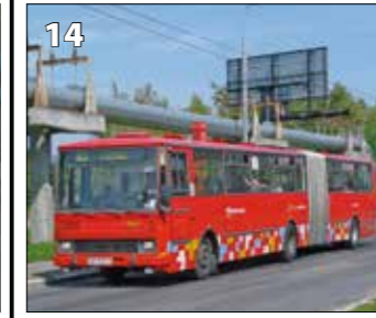
Karosa B741 CNG – r. v. 1992