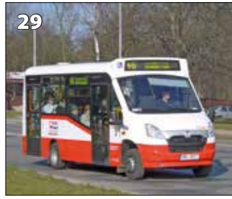
Iveco Stratos LF 38 D – r. v. 2013