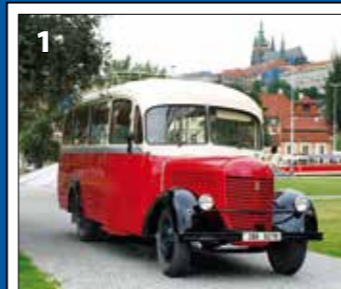
Praga RND – r. v. 1949