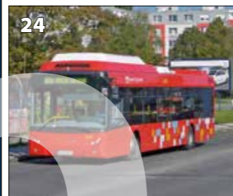
Tedom C 12 G – r. v. 2010