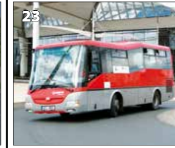
SOR CN 8.5 – r. v. 2011