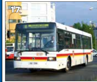
Škoda 21AB – r. v. 1995