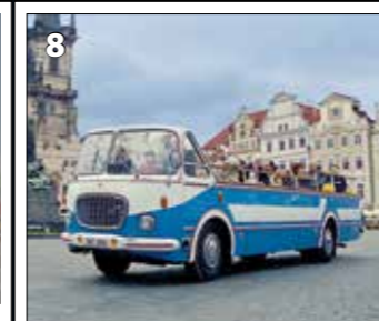
Škoda 706 RTO vyhlídkový - 1967