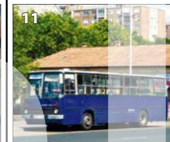
Ikarus 260.46 – r. v. 1991