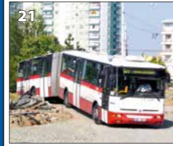
Karosa B961E.1970 – r. v. 2006