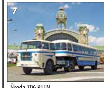
Škoda 706 RTTN + Karosa NO80 - 1958