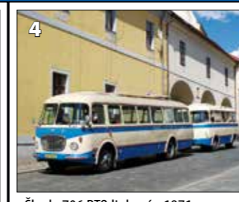
Škoda 706 RTO linkový - 1971 + Jelcz P01E - 1976