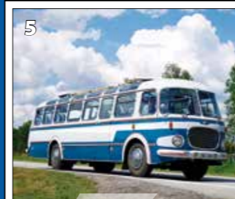
Škoda 706 RTO lux - 1962