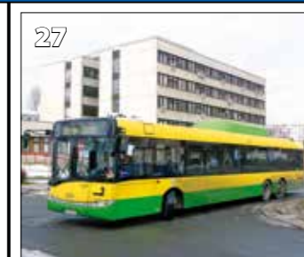
Solaris Urbino 15 CNG – r. v. 2006