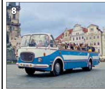
Škoda 706 RTO vyhlídkový - 1967