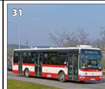
Irisbus Crossway 12 M LE – r. v. 2010