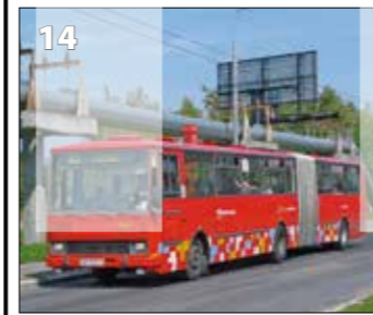
Karosa B741 CNG – r. v. 1992