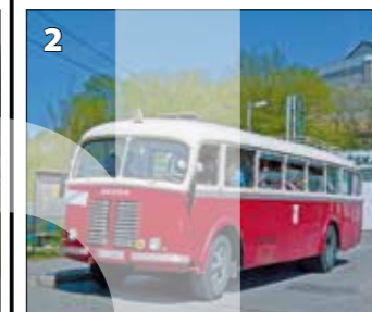
Škoda 706 RO – r. v. 1947