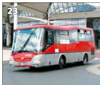
SOR CN 8.5 – r. v. 2011