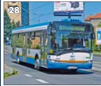
Solaris Urbino 12 – r. v. 2011