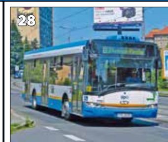
Solaris Urbino 12 – r. v. 2011