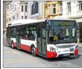
Iveco Urbanway 12 M CNG – r. v. 2015