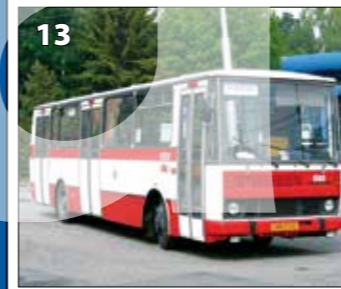
Karosa B731.04 – r. v. 1986