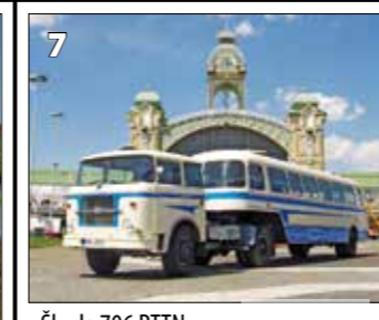
Škoda 706 RTTN + Karosa NO80 - 1958