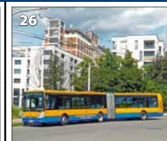
Irisbus Citelis 18 M – r. v. 2010