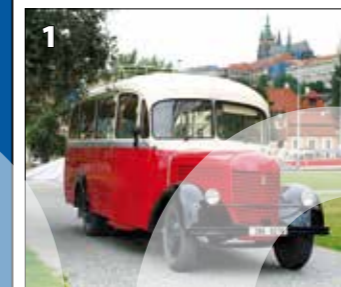
Praga RND – r. v. 1949