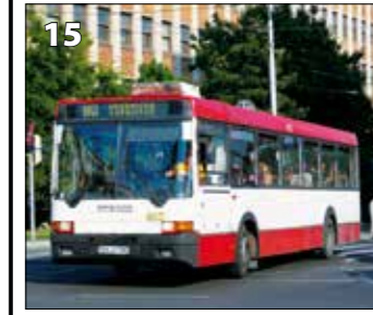
Ikarus 415 – r. v. 1998