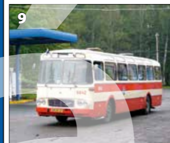
Karosa ŠM 11 – r. v. 1981