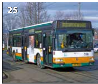
Irisbus Citybus 12 M – r. v. 2001