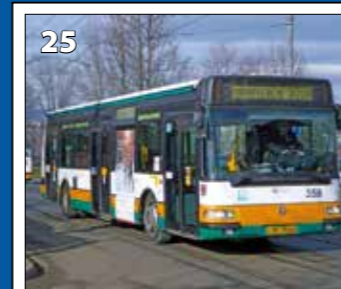
Irisbus Citybus 12 M – r. v. 2001