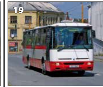
Karosa B952E.1716 – r. v. 2004