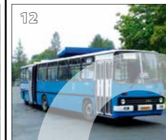
Ikarus 280.10 – r. v. 1988