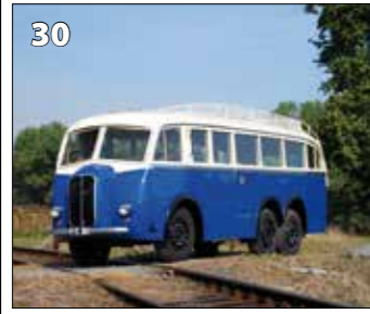
Tatra 85/91 - 1938