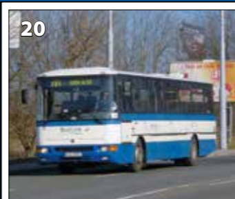
Karosa C954E.1360 – r. v. 2005