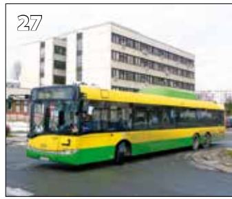
Solaris Urbino 15 CNG – r. v. 2006