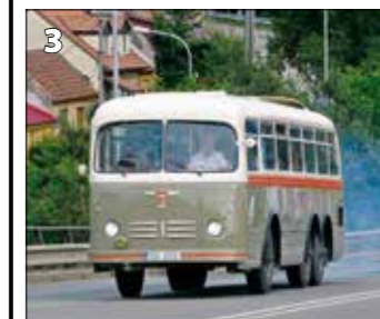
Karosa – Tatra 500HB – r. v. 1956