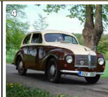
Aero Minor II