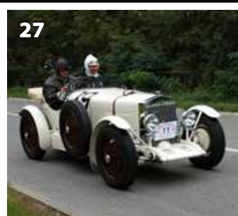
Wikov 7/28 Sport