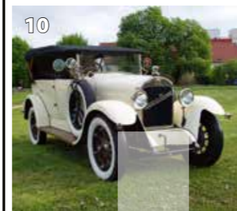
Laurin &amp; Klement 110