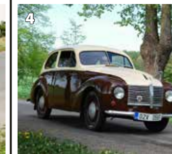
Aero Minor II