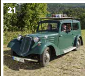
Tatra 57 B STW