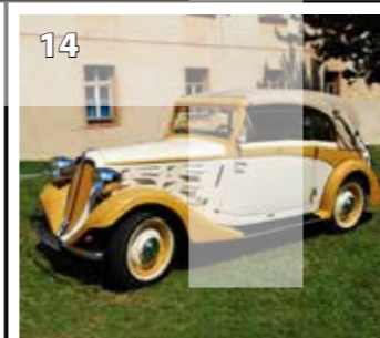
Praga Super Piccolo kabriolet