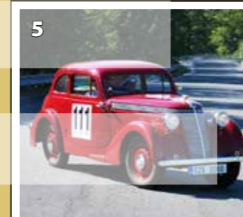
Jawa 600 Minor