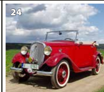
Walter Junior kabriolet