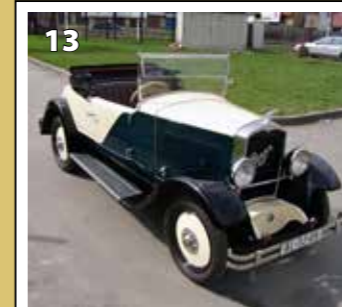
Praga Piccolo sport