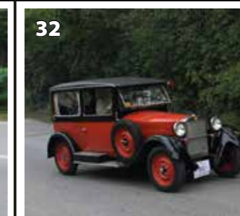
Z 18 limuzína