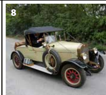
Laurin &amp; Klement 100