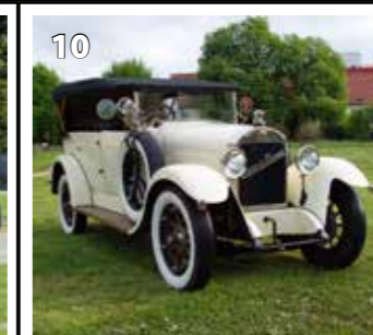
Laurin &amp; Klement 110