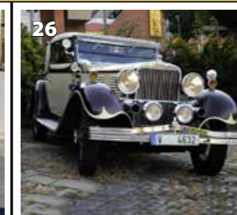
Walter Super 6B