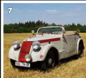
Jawa Minor I