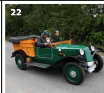
Tatra 11 Normandie