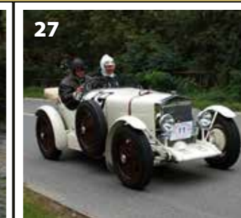
Wikov 7/28 Sport