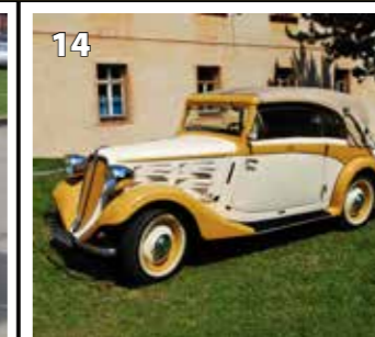
Praga Super Piccolo kabriolet