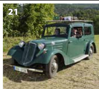
Tatra 57 B STW