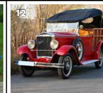
Praga Piccolo Normandie