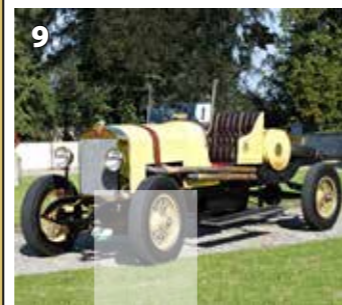
Laurin &amp; Klement 300