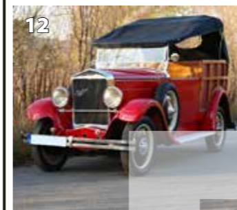
Praga Piccolo Normandie