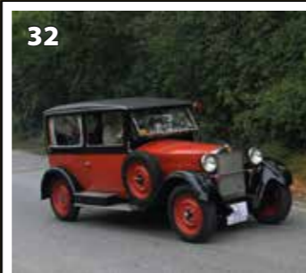
Z 18 limuzína

Připravili jsme pro vás pexeso s automobilovými veterány vyrobenými na našem území. Jsou zde zastoupeny největší automobily od Rakouska-Uherska po rok 1950. Některé vozy se dochovaly v jediných exemplářích. Na srazích veteránů je spatříte jen zřídka. Výroba automobilů má v naší zemi bohatou tradici. Naši dědové to neměli lehké si z této velké nabídky vybrat. Uznejme také tvrdou práci dnešních majitelů, kteří se o tyto „plechové krasavce“ starají. Bez těchto automobilů by nemohl vzniknout ne jeden historický film. Užijte si poučnou hru a těšte se na další pokračování na podobné téma. Více na www.tojemi.cz