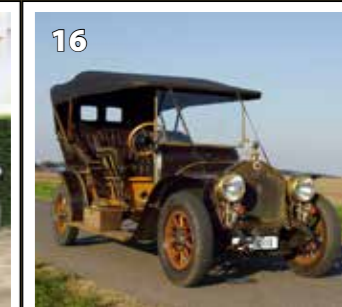
RAF H 10