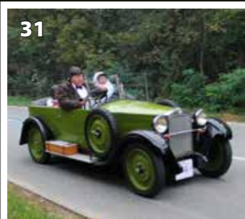
Z 18 faeton