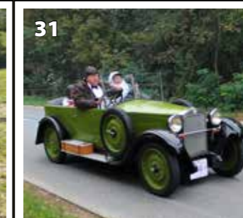
Z 18 faeton