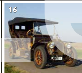
RAF H 10