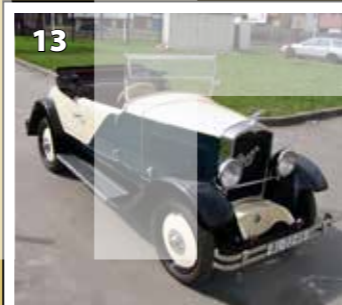
Praga Piccolo sport