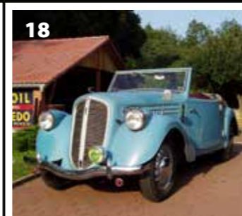
Skoda 1100 Popular