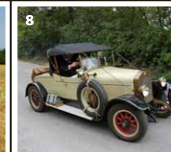
Laurin &amp; Klement 100