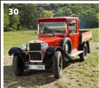
Z 18 valník