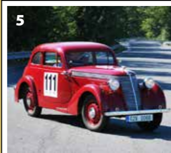
Jawa 600 Minor