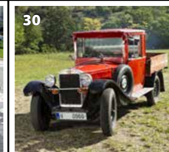
Z 18 valník