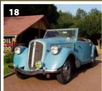
Skoda 1100 Popular