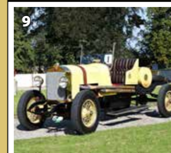
Laurin &amp; Klement 300