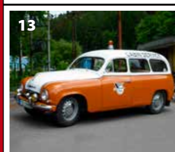
Škoda 1201 STW