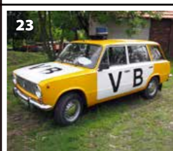
VAZ 2102 - Veřejná Bezpečnost