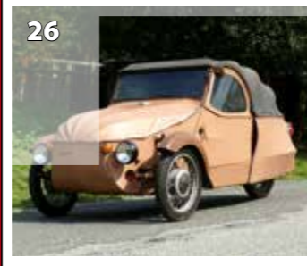
Velorex 16 350