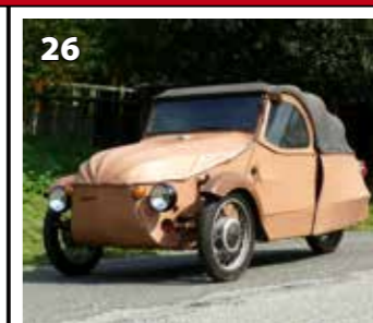
Velorex 16 350