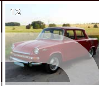
Škoda 1000 MB