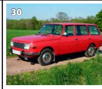
Wartburg 353 Tourist