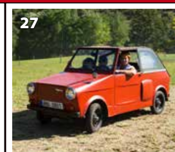
Velorex 435-O B