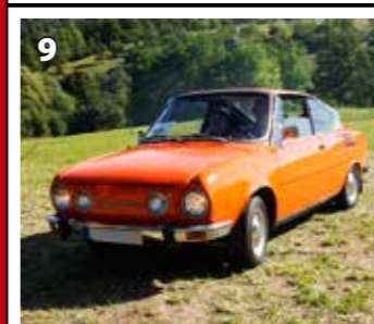
Škoda 110 R