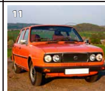
Škoda 120 GLS