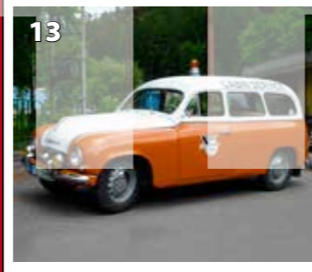
Škoda 1201 STW