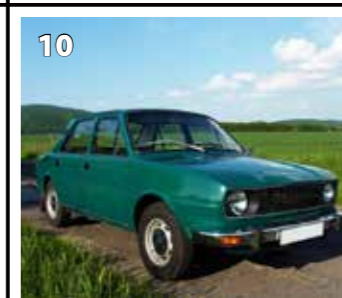
Škoda 120 L