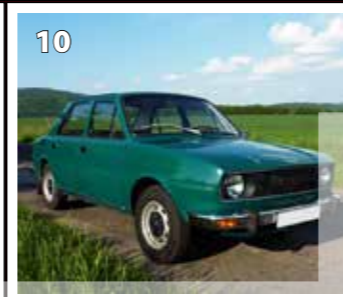
Škoda 120 L