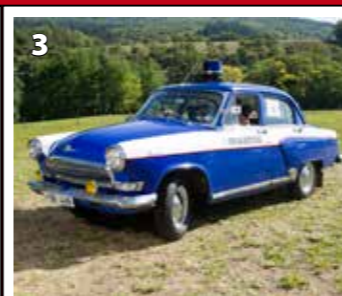
Volha 21 - Veřejná Bezpečnost