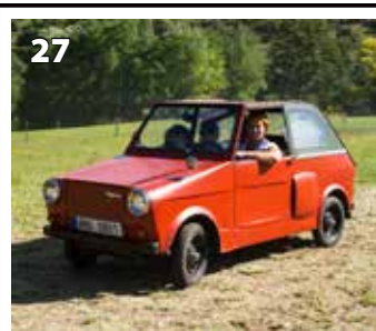
Velorex 435-O B