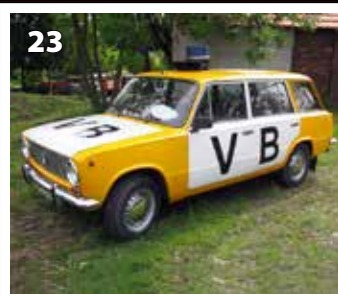
VAZ 2102 - Veřejná Bezpečnost