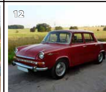
Škoda 1000 MB