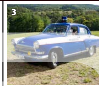
Volha 21 - Veřejná Bezpečnost