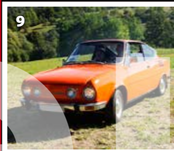
Škoda 110 R