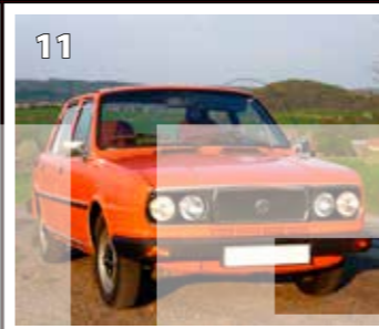
Škoda 120 GLS